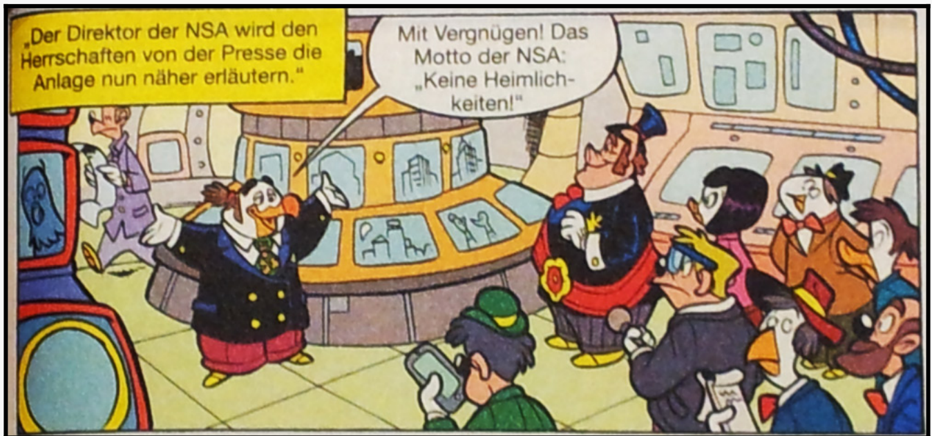
Abbildungen aus dem LTB 449, Ehapa-Verlag

In der Dezember-Ausgabe ist es die Geschichte "Verdächtig sicher" über die NSA, die hier "Nasweis, Spicker und Ausspecht" genannt wird. In Zusammenarbeit mit der Regierung in Form des Bürgermeisters und der Wirtschaft werden in der Kleinstadt 1.900 Kameras installiert, die alle Straßen und jede Ecke überwachen, um damit angeblich die Kriminalität zu bekämpfen. Anfangs geht das Konzept auch auf, bis deutlich wird, dass die NSA ihre ganz eigenen Vorstellungen von Recht und Gesetz hat. Am Ende werden die Kameras wieder abgebaut und die NSA-Führung verhaftet – an diesem Punkt zeigt sich leider, dass die Geschichte von der Realität doch recht weit entfernt ist.